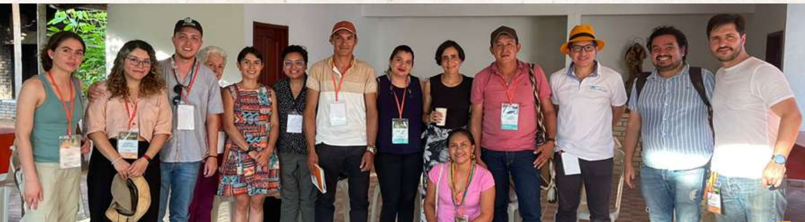
Diálogo con sociedad civil colombiana y Ministra de Ambiente, Susana Muhamad. Julio 6 de 2023.

Además, en este diálogo el Ministerio de Medio Ambiente colombiano compartió que la posición del país estará en torno a las medidas que sean necesarias para evitar el punto de no retorno de la Amazonía y en prestar especial atención a los proyectos relacionados con hidrocarburos y minería en este ecosistema, responsables de la degradación de esta selva.