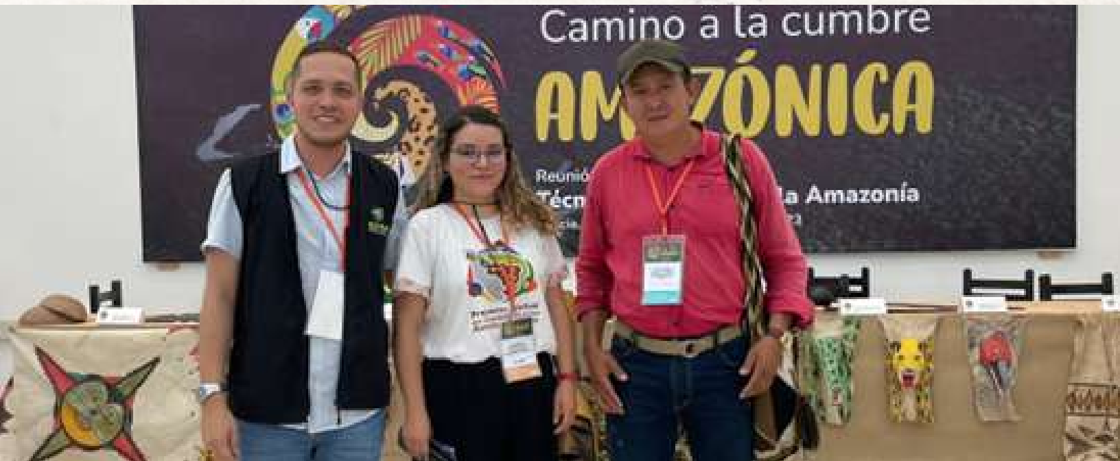
Representantes de REPAM, Colombia, Secretariado Nacional de Pastoral Social Cáritas Colombiana y ASCATRUI (Asociación de Campesinos y Trabajadores de la Unión de los Ríos Unilla e Itilla).

A pesar de la poca presencia de los territorios destacamos que en los diálogos se resaltó la importancia de las bases comunitarias para involucrarlas, no solo en la gobernanza de sus territorios, sino en la formulación, implementación, seguimiento y veeduría de los mecanismos de financiación ; que la investigación y la transmisión de la información necesita ser más accesible y responder a un qué y para qué desde los territorios ; la necesidad de planear, construir y fortalecer ciudades y economías con identidad amazónica , que integren en su planificación la selva y lo que implica vivir en este ecosistema, donde la autonomía sea clave; que la academia e investigación sea también para las comunidades, destacando su papel y pensar; y que las políticas sobre deforestación sean integrales e integren diferentes sectores, además del ambiental o el de defensa.