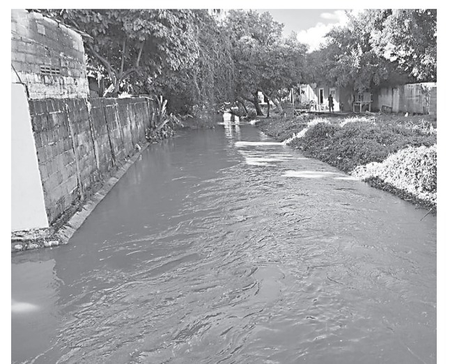
SEGÚN SE MANIFESTÓ seguirán registrándose afectaciones, por lo que la solución que se plantea, es que la comunidad sea retirada de las zonas que más se vislumbra un posible daño.