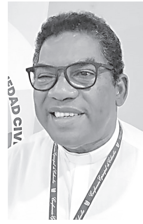
EL PADRE RAFAEL CASTILLO , presidente del Secretariado Nacional de Pastoral Social.

“Con los valores del evangelio podemos globalizar la solidaridad, apostarle a tener buenos gobiernos y ciudadanos, que podamos enfrentar la cultura de la corrupción que es la que más muerte genera, con categoría ciudadana y con esperanza”, enfatizó el sacerdote.