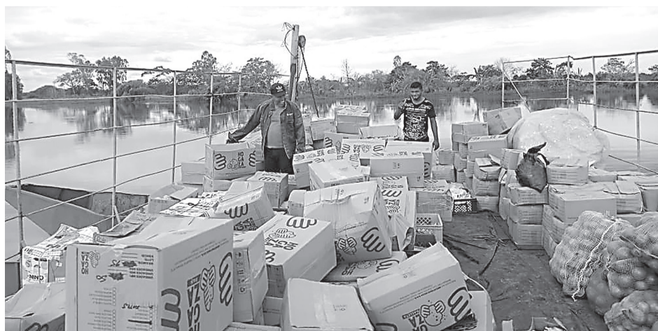
LAS LLUVIAS HAN dejado como saldo el mal estado de las vías, lo que ha generado que hasta el vehículo que transporta los alimentos del PAE, no haya podido llegar ayer por vía terrestre.

Cabe destacar que, el Departamento se encuentra en alerta por el aumento de los caudales de los ríos que descienden de la Sierra Nevada de Santa Marta.