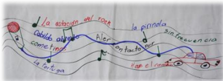
Dibujo hecho por el Colectivo “Los Cometines”

Nuevos aires vienen para San Gil, La Cometa asume el compromiso de ser un actor relevante en la construcción de modos de vida justa, en el Buen Vivir de los pueblos de esta hermosa tierra colombiana.