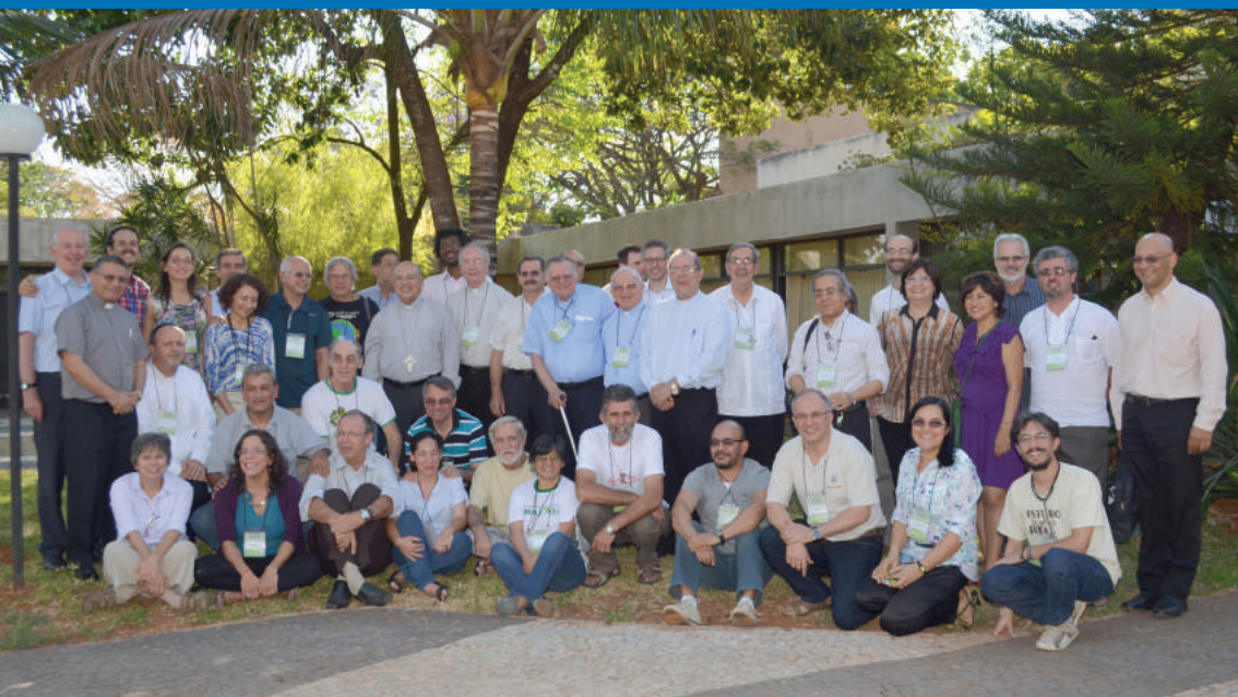
Fotografía de las y los Participantes del Encuentro Fundacional de la REPAM