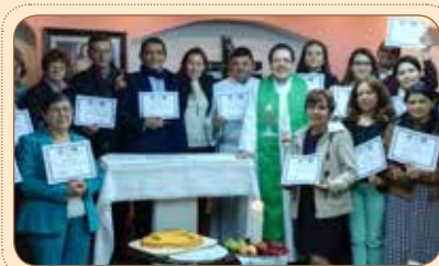
Formación de Pastoral de Movilidad Humana – CAMIG, marzo – mayo 2016