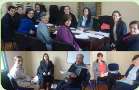
El Centro de Dimensión Social de la Evangelización de la que hace parte la Pastoral de Movilidad Humana, se reúne periódicamente. En esta ocasión (28 de julio 2016 en la Curia), diseñando 3 de los 10 Proyectos Fundamentales, con los que se espera darle un Nuevo Rumbo a nuestra Iglesia Arquidiocesana.