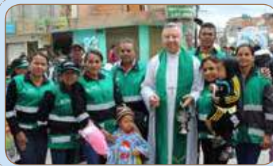
Diócesis de Fontibón continúa acompañando en la fe a los recicladores Julio 2016. Celebrando con la Virgen del Carmen